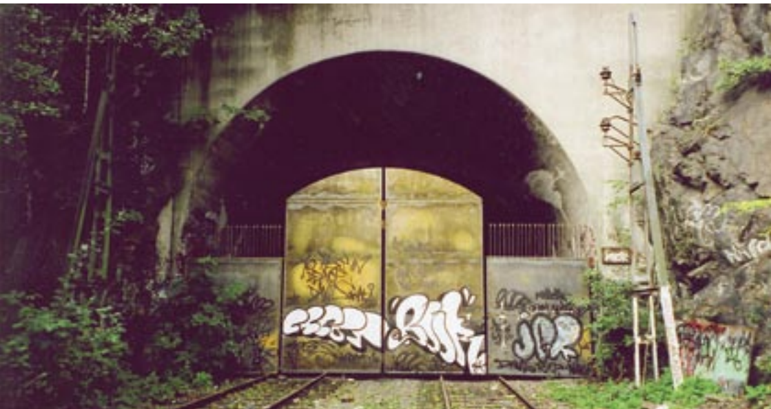
En av de boplatser som mobila teamet besökte.

” Det är en grupp skygga människor. De är rädda för sjukhusmiljöer och har ofta dåliga erfarenheter av myndigheter som de ser som sina fiender. Många har också dålig självinsikt och förstår inte att de är sjuka och borde söka hjälp. ”