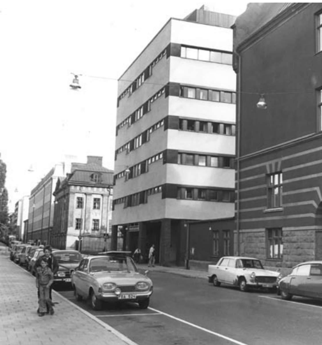
Mariamottagningens bvvudentré 1974.