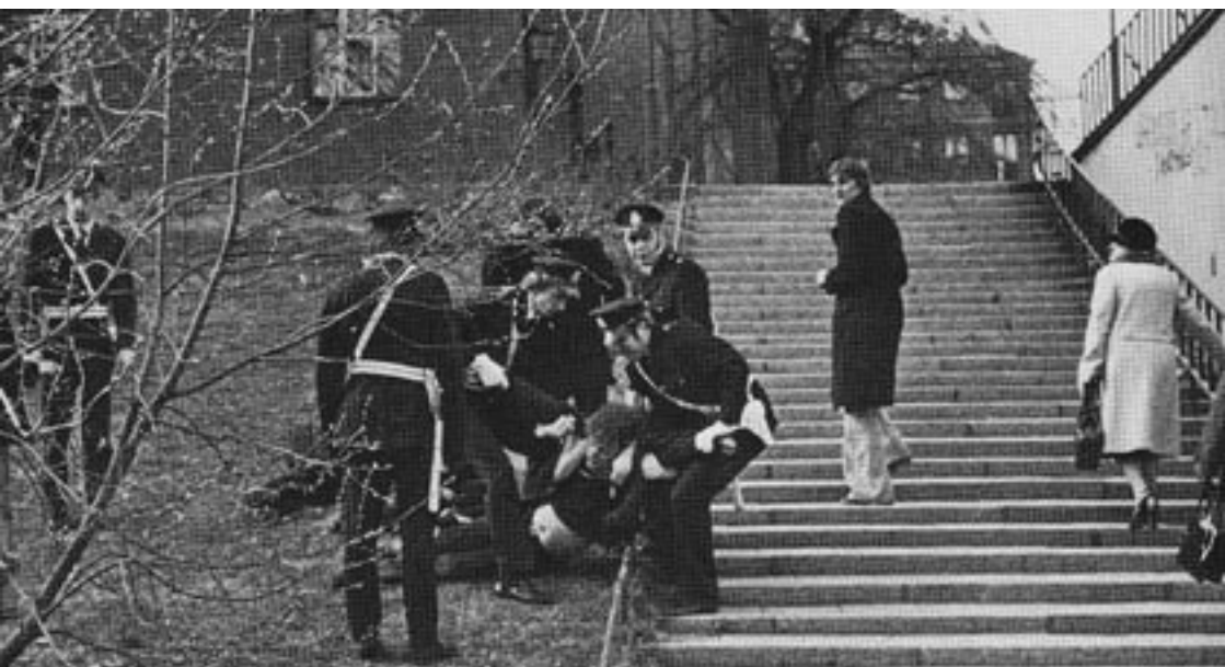
Polisingripande mot fyllerist under tidigt 70-tal.

Vid sidan om den politiska turbulensen fortsatte mottagningarna att arbeta under högt tryck och många fick avvisas. Situationen blev ännu hårdare när en ny lag infördes 1977: Lagen om vård av berusade personer (LOB). Den innebär att man i första hand skall erbjuda berusade personer vård istället för att, som det hette förr, ”finka” dem. Tanken var god och lagen gäller än idag, men 1977 blev bördan på akutmottagningen enorm med ungefär 100 extra besök per dag. De som arbetade då berättar att det ibland kunde vara ett tiotal polisbilar utanför akutmottagningen samtidigt.