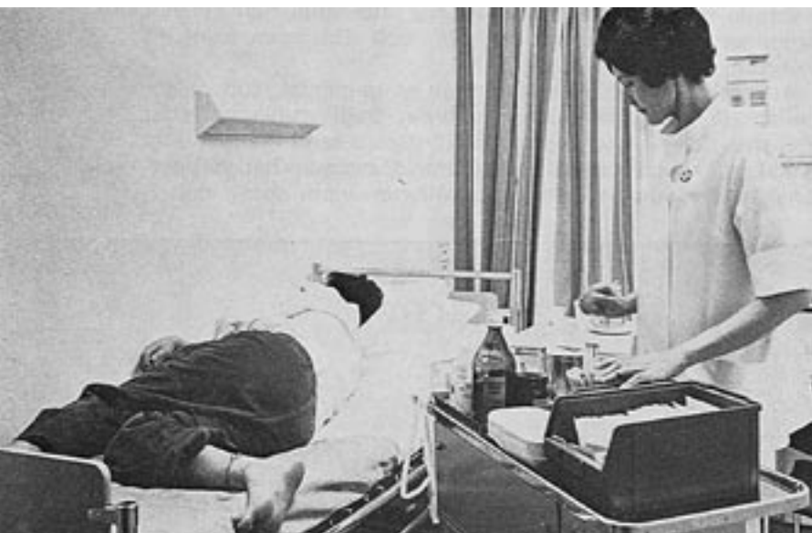
Ett av de åtta patientrummen på akutavdelningen 1970.

I ordet "stadsbidragberättigad" låg haken, och nu blir det krångligt: Socialstyrelsen bestämde sig för att de bara skulle betala för korttidsvård som inte fick bli längre än 6 dagar, resten skulle landstinget stå för eftersom det då borde handla om riktigt sjuka och det var ju landstingets bord.