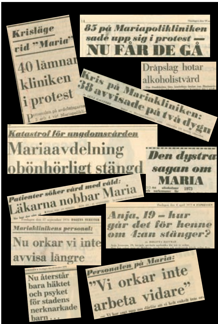
Läser man bara tidningsrubrikerna från 70-talet är det svårt att förstå hur någon kunde orka arbeta på Maria i huvud taget.